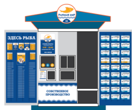
Павильон-рефрижератор от 30 м 2