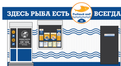
Магазин с торговым залом от 45 м 2