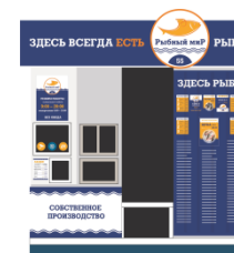
Павильон от 20 м 2

Длина корпуса 12 метров (+1,5 метра буферной зоны) Ширина корпуса 2,5 метра